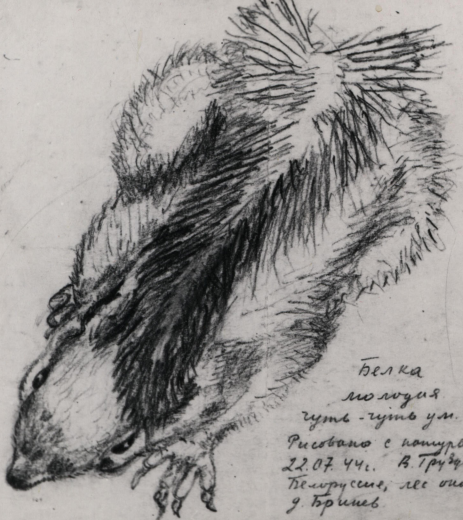
Белка молодая ♀ зимь - зимь уш. Рисовано с натуры 22.07.44г. В. Труднев. Белоруссия, лес около г. Брест.