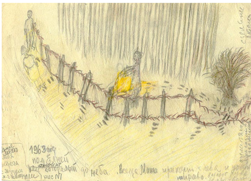
СОН Карандаш, набросок, 1963 THE DREAM Pencil, sketch, 1963