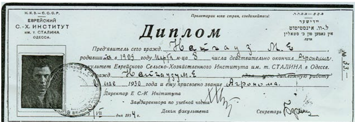
Диплом об окончании сельско-хозяйственного института, 1930 год